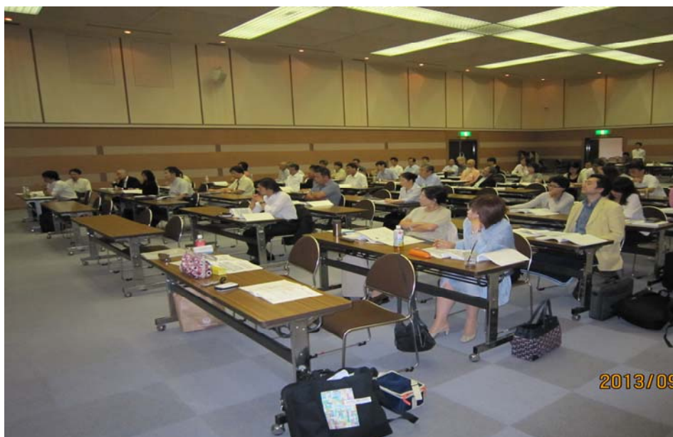
「パネルディスカッションの様子②」