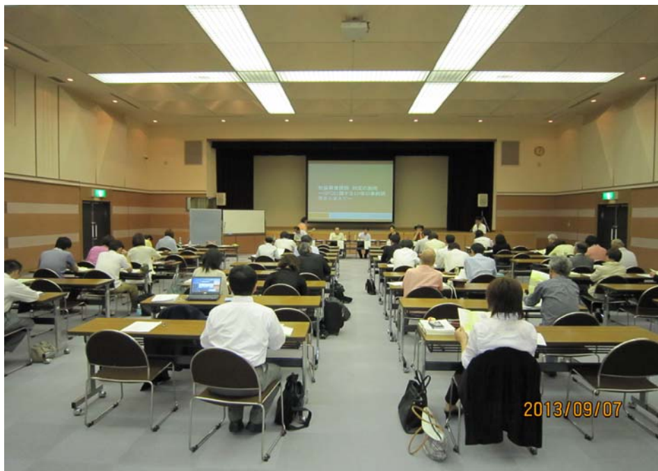
「パネルディスカッションの様子①」